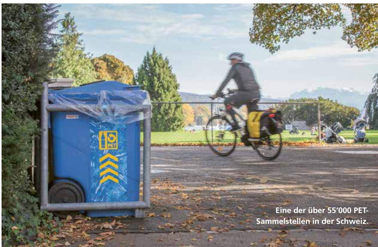
Eine der über 55'000 PET-Sammelstellen in der Schweiz.

Durch die Kombination der Netze der verpflichteten und freiwilligen Sammelstellenbetreiber kann der Schweizer Bevölkerung ein Service public geboten werden und eine flächendeckende, dichte Sammelinfrastruktur, die bis in die entlegensten Bergtäler reicht. So ist das Sammelstellennetz von PET-Recycling Schweiz rund drei Mal grösser als das Postnetz (Briefkästen und Poststellen zusammen).